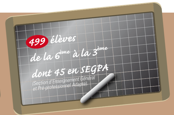
Collège de Crussol