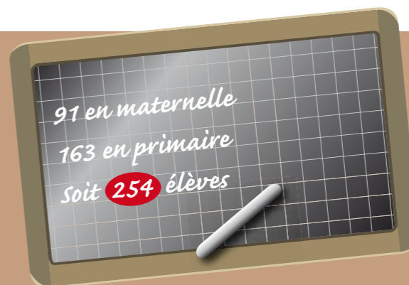
Groupe scolaire privé catholique de la Sainte Famille