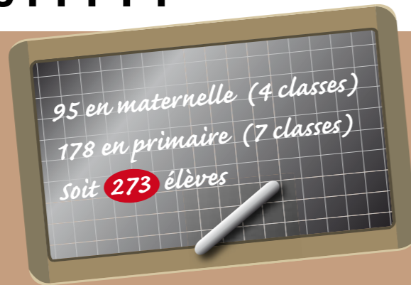
Groupe scolaire du Quai

Lundi 5 septembre, à l'ouverture des grilles et des portes de nos établissements, ce sont 273 élèves de maternelle (- 6,5 % par rapport à 2010) et 507 élèves de primaire (+ 3 % par rapport à 2010) qui ont repris le chemin de l'école, répartis entre les trois groupes scolaires de la commune (Quai, Brémondrières et le groupe privé Sainte Famille), auxquels il convient d'ajouter 499 collégiens (+ 4,3 % par rapport à 2010).