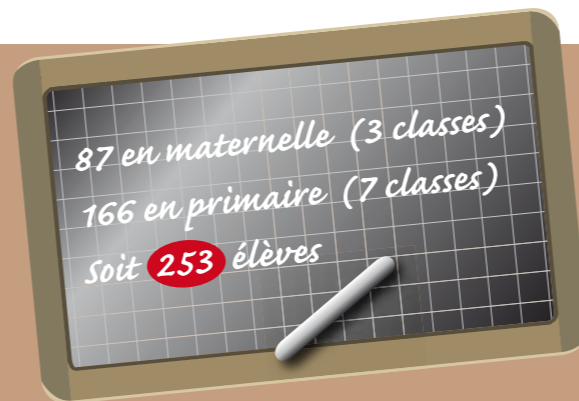
Groupe scolaire des Brémondrières