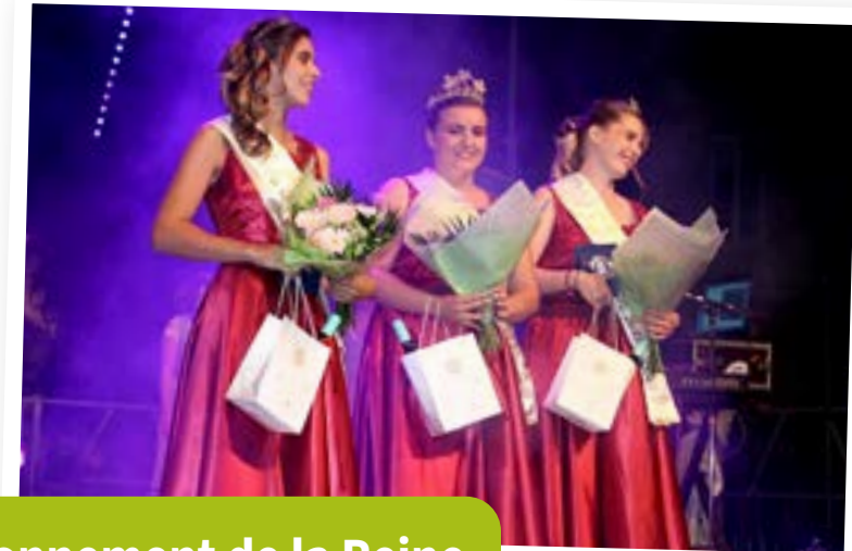
Couronnement de la Reine