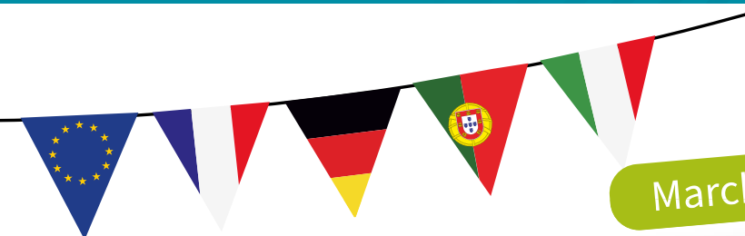
Marché aux vins.