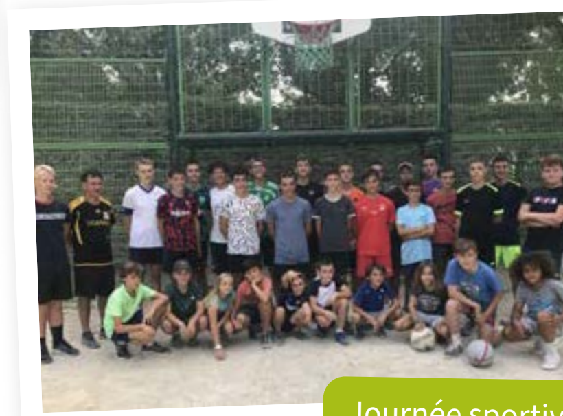
Journée sportive : rando pédestre, cycliste, tournoi de football et de rugby.