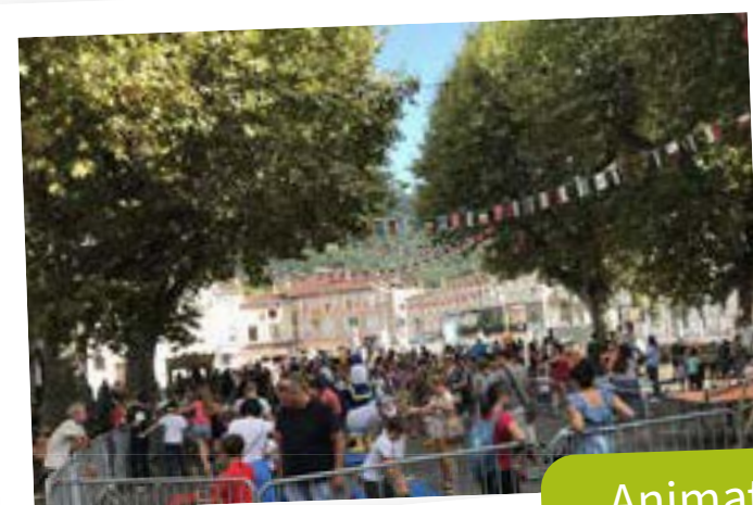
Animations dans les rues.

Le public était heureux de pouvoir à nouveau partager un moment de convivialité et l'ambiance familiale, festive et joyeuse a fait battre le cœur du centre-ville trois jours durant.