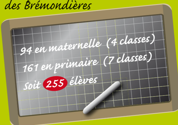
Groupe scolaire des Brémondrières